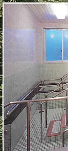
石畳調の快適なお風呂