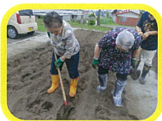
☆5月下旬～6月上旬 あんじゅ農園 苗植え