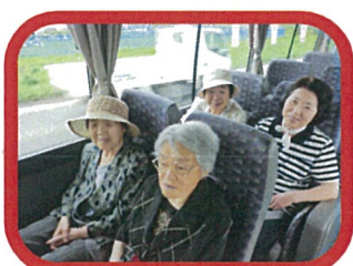
☆6月下旬～7月(予定) 外出行事(行き先:鹿追町)