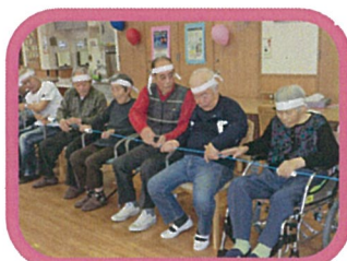
☆10月(日程未定) あんじゅ音更運動会