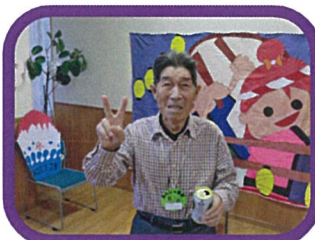
☆7月13日(日) 第11回あんじゅ音更夏祭り