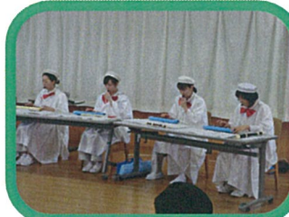
☆12月15日(月)～12月19日(金) クリスマス&忘年会