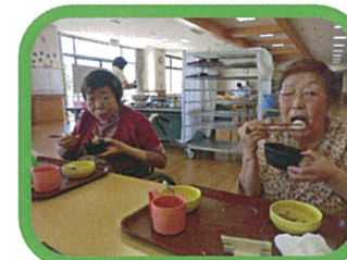
☆平成27年3月(日程未定) 昼食行事

他にも5月・9月・12月・3月には“変わり湯週間”を実施し、普段とは違った雰囲気の中で、入浴を満喫して頂きます。また今年も作った野菜で、イモ団子や浅漬けに調理加工をする計画もありますので、お楽しみに！！