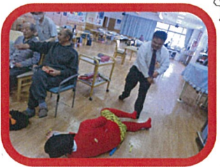
☆平成27年2月3日(水) 節分行事