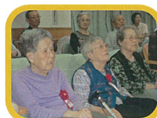
☆9月8日(月)～9月12日(金) 敬老週間