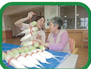
☆11月(予定) 漬け物作り