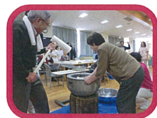
☆平成27年1月7日(水) 餅つき行事