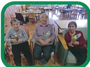
☆5月5日(月)～5月10日(土) 母の日週間

まだ少し肌寒く感じる日もありますが、桜前線も近付き春らしい季節になって参りました。今年の音更の開花予想日は、5月5日前後となっているようです。今年度の事業目標は『心の通った質の高いサービス提供』を掲げ、皆様の心から最高の笑顔が溢れるような事業所を目指していきたくて思っております。その為に、下記のような行事やレクリエーション等を計画しております。写真は去年の行事風景ですが、今年度も皆様のご利用を職員一同心よりお待ちしております。