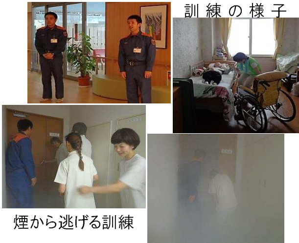
煙から逃げる訓練

当施設では、この訓練を生かし、緊急時の対応に役立てられるよう取り組んでまいります。