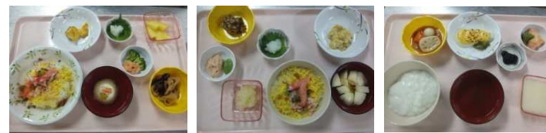
( 常菜 ) ( ソフトきせみ ) ( ムース )

かに散らし・すまし汁(吹き寄せ包み・貝割れ) 祝肴(魚ウニソース焼き・ゆでえびと野菜)れんこんと昆布の煮物・果物